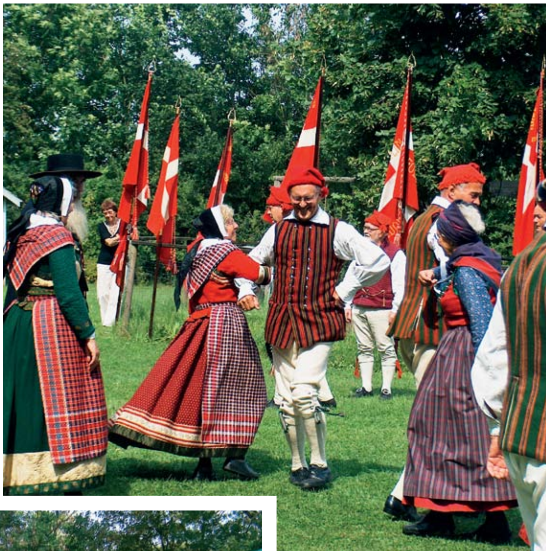
Opvisning ved dansere fra Hornsherred og Hvalsø. (Bertel Stenbæk, Maj 1986 Høng)