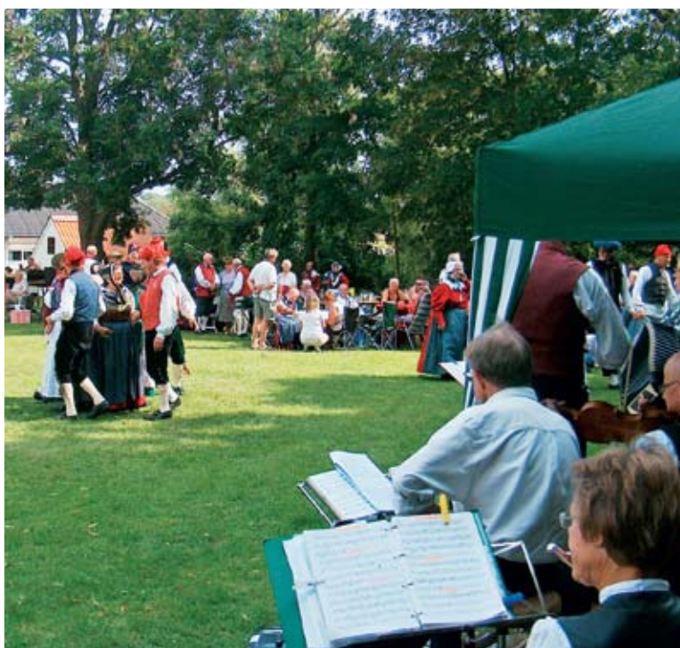
Der spilles, danses og hyggesnakkes ved Folkedansens Dag på Andelslandsbyen Nyvang ved Holbæk. (Bertel Stenbæk, Maj 1986 Høng)