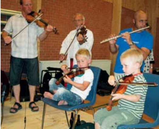
Små og store spillemænd leverer i fælles samklang musikken til en god svingom.

I Tommerup har der været familielandsstævne for folkedansfamilier fra hele landet. Det lykkedes at samle 230 børn, forældre og bedsteforældre, som deler den fælles glæde at danse folkedans.