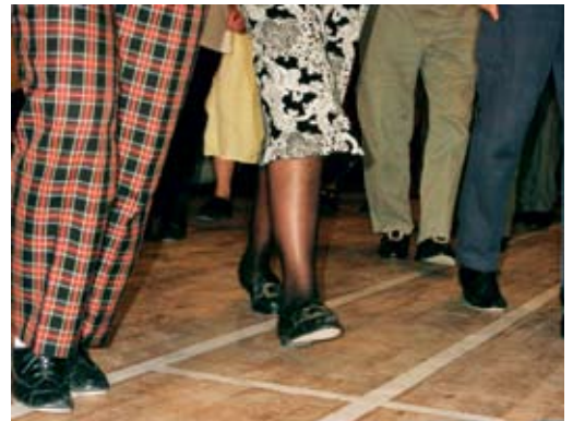
"Danseben på Nytårskursus - Snoghøj 2009"

Vel mødt for både nye og "gamle" deltagere til nytårskurset på Snoghøj.