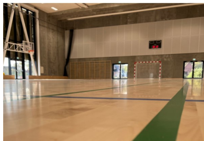
Skolens nye Idrætshal