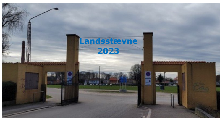
Porten til Ringriderpladsen